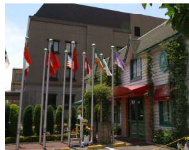
三ツ星ベルト株式会社が運営しているカフェ「MMコート」。地域住民も利用している。