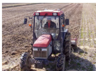
グリーンファームささやま