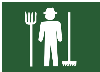
受入先 7 団体

農業農村に関する理解の深化と実践的な立案・調整能力を身につけることを目的とした実習。