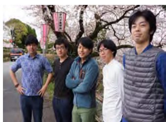
地域おこし協力隊